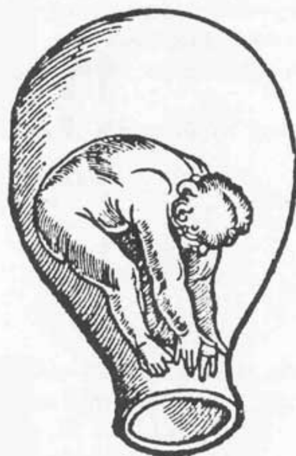
Fostrets olika lägen i livmodern enligt "Rosengarten".

Lönen var till en början 63 kr. i månaden. "Så då sätter ho väl in 40?" Varje nedkomst betalades extra med kr 5:– eller 10:–. Beroende på om barnafadern ansågs fattig eller tillhörande "bättre folk". "Å vart räkner ho mej då", kunde husbonden fråga och oskuldsfullt bliga upp i taket. Ibland uteblev det extra honoraret, "för ho har ju sin fasta lön".