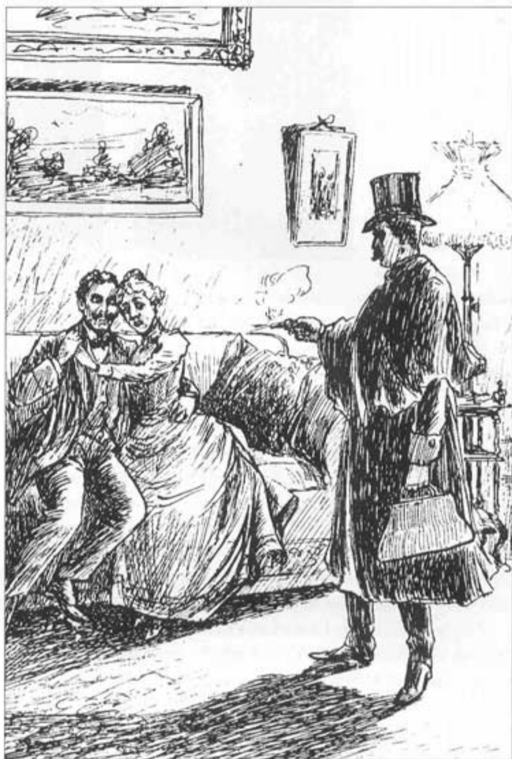
BILD UR JÄNTA Å JA AF GUNNAR FORSSMAN, 1904: Han fann sin hustru i kompanjonens armar och sköt honom på stället.

Men tillbaka till sensationsromanerna. De tre ovan nämnda exemplen är givetvis inte vad vi i dag kallar deckare . De har dock kriminallitterära intriger och inslag som är av intresse också för deckarvänner, inte minst av historiska skäl. Självklart finns många fler böcker som helt eller delvis handlar om brott och brotts-